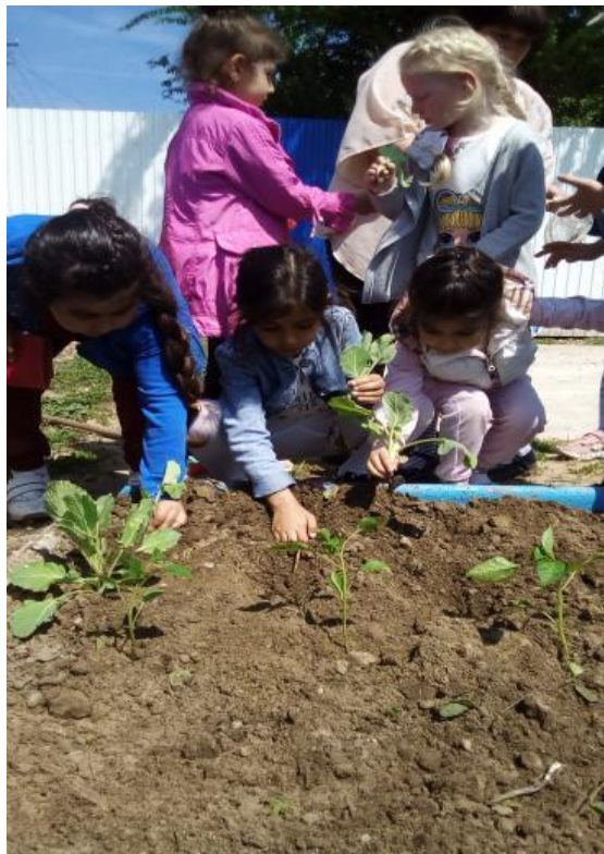
полив нашего огорода